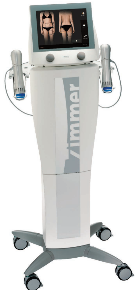
Abb. 5: Stoßwellentherapiegerät Z WavePro.