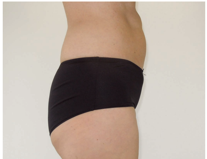
Abb. 1a-b: Erscheinungsbild jeweils vor (l.) und 8 Wochen nach Kombinationsbehandlung mit Kryolipolyse (Z Lipo) und Stoßwellentherapie (Z WavePro).