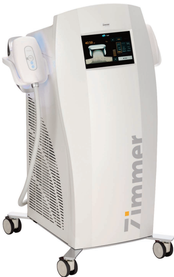
Abb. 4: Kryolipolysesystem Z Lipo.

Kombination einer Stoßwellentherapie nach erfolgter Kryolipolysebehandlung: So kann eine bessere und signifikant schnellere Fettreduktion erreicht werden. Ein weiterer, nicht zu unterschätzender Pluspunkt der Stoßwellenbehandlung ist die Verbesserung des Hautbildes. Grundsätzlich ist bei jeder Art von Fettreduktion eine Behandlung zur Hautstraffung empfehlenswert. Insgesamt bietet die Kombination von Kryolipolyse und Stoßwellentherapie drei entscheidende Vorteile gegenüber der konventionellen Kryolipolyse: Schnellerer Fettabbau, effektivere Fettreduktion und Straffung der Haut.