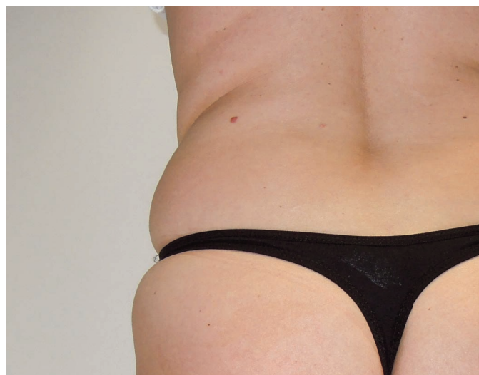
Abb. 2a-b: Erscheinungsbild jeweils vor (l.) und 8 Wochen nach Kombinationsbehandlung mit Kryolipolyse (Z Lipo) und Stoßwellentherapie (Z WavePro).

Die Intensität des Vakuums lässt sich in 10 verschiedenen Stufen auf die zu behandelnden Körperareale einstellen. Darüber hinaus verfügt das Z Lipo System über eine weitere