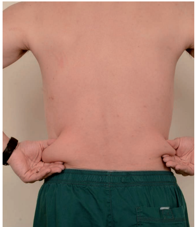
Abb. 3: Deutlicher Unterschied zwischen Handmassage (linke Seite) vs. Stoßwellenbehandlung mit Z WavePro (rechte Seite) nach Kryolipolyse.